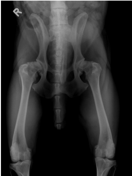
Hüfte gestreckt, 20.06.2012